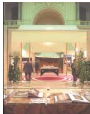
NELLA PAGINA ACCANTO: Il Centro Islamico Culturale d'Italia a Roma. IN ALTO: Viale della Moschea. SOPRA: Interno della Mostra "Scoprire il Pellegrinaggio nell'Islam in cammino con Abramo", Pontificia Università Gregoriana, Roma.